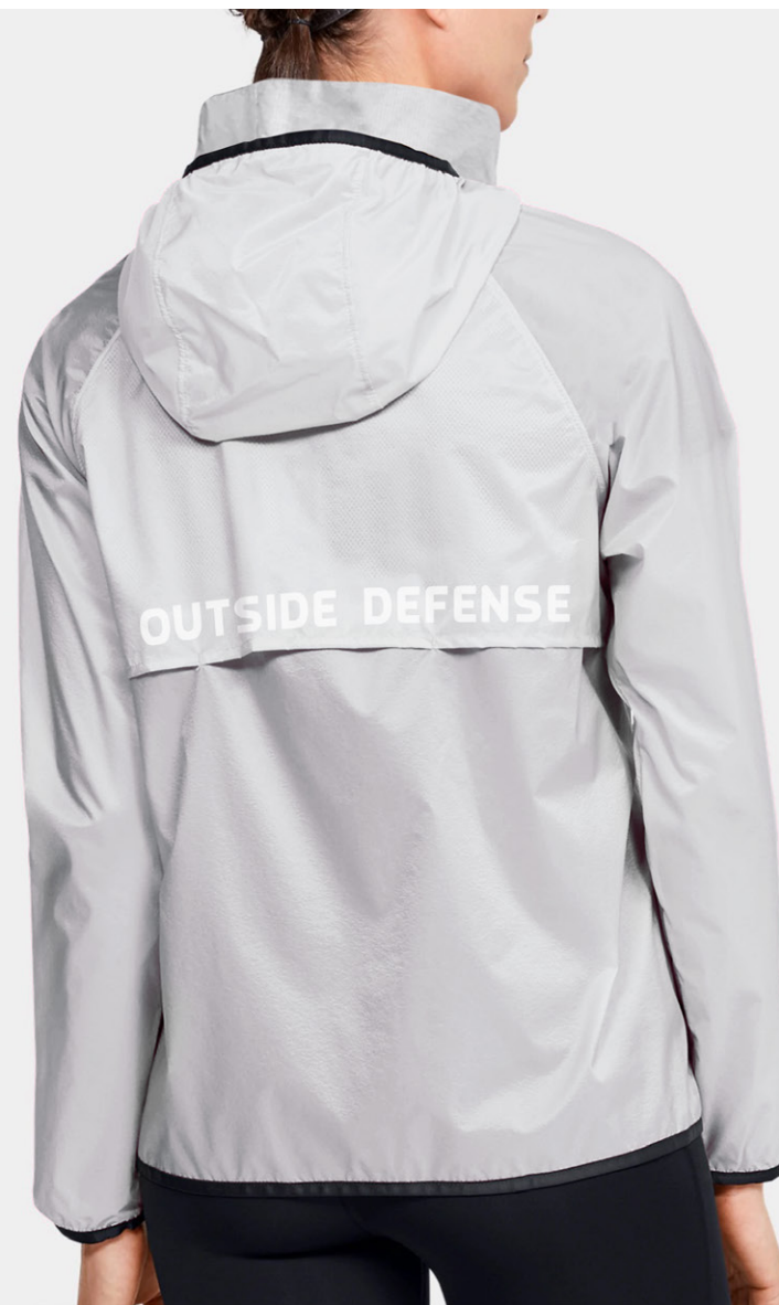
正面右胸印白 + 後背印白