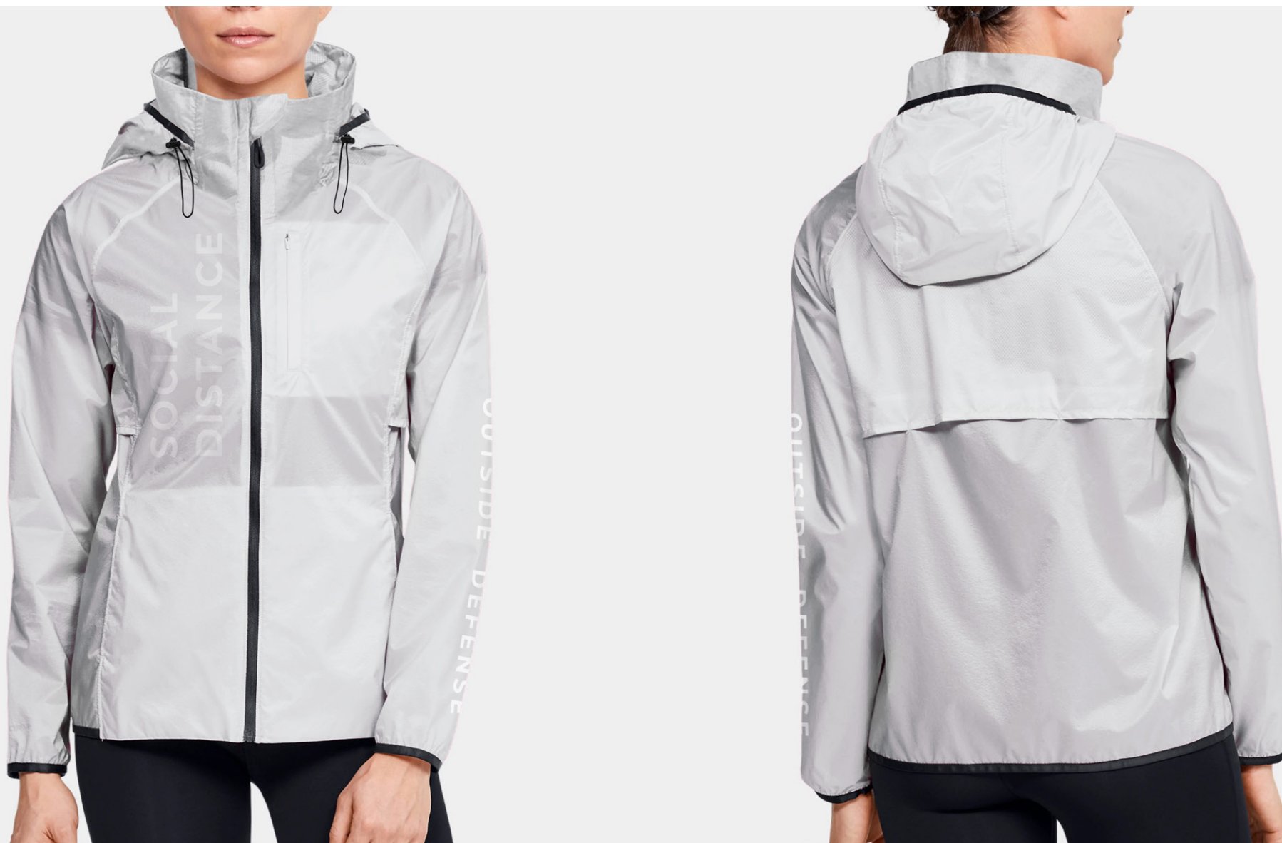
正面手臂處印白 + 右胸反面印白